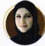
الشيخة العلوود بنت حمد آل ثاني نائب الرئيس التنفيذي والرئيس التنفيذي للشمال مركز قطر للأعمال